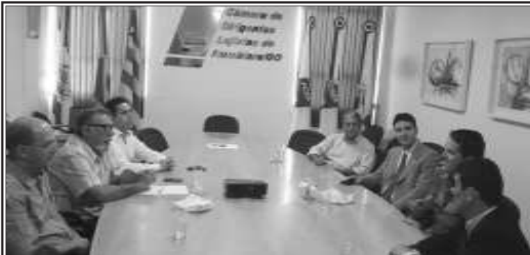
Representantes do Fórum Empresarial, MP, Câmara, PM e Judiciário durante a reunião

Durante a Semana Nacional do Meio Ambiente a Prefeitura de Itumbiara e a AMMAI divulgam as várias atividades realizadas pela agência em prol do ambiente. E no domingo (5), a partir das 8h, realiza uma caminhada ecológica pela Beira Rio, com concentração na ULBRA.