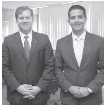
Ministro Marx Beltrão e o prefeito Zé Antônio

Prefeito Zé Antônio (PTB) esteve na semana passada em Brasília, quando teve audiência com o ministro do Turismo Marx Beltrão, que é deputado federal licenciado do PMDB alagoano. No encontro, Zé Antônio solicitou a liberação de recursos da União para realizar da XIII edição do Arraiá de Itumbiara, previsto para o mês de junho. Falou sobre a importância e o caráter regional da festa, que atrai todos os anos mais de 200 mil pessoas à cidade, além do aspecto social da festa, onde mais de 30 entidades filantrópicas trabalham com a venda de comidas e bebidas típicas, onde o lucro é revertido em projetos e ações sociais que atendem milhares de crianças, adolescentes, adultos e idosos nas mais diferentes áreas.