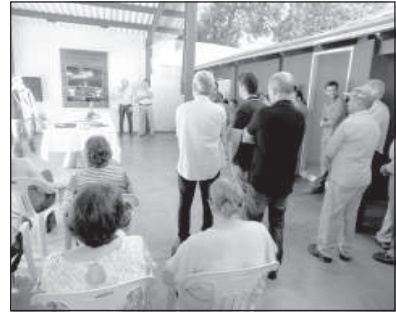
Café com o Presidente no Sindicato Rural de Itumbiara